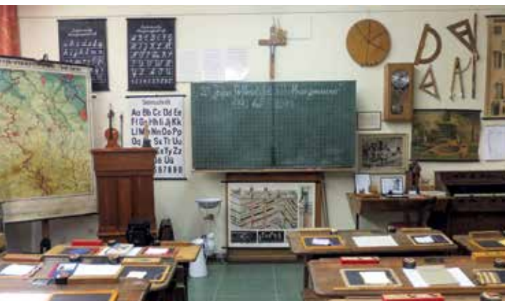
Historisches Klassenzimmer Immendorf