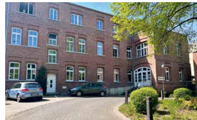
Musikschule Geilenkirchen in der Nähe des Rathauses

Für Kinder ab 4 Jahren wird die Musikalische Früherziehung angeboten. In den verschiedenen Musikalischen Grundausbildungen ab 6 Jahren haben die Kinder bereits die Möglichkeit mit ihrem Lieblingsinstrument zu beginnen. Einzel- und Gruppenunterricht für Kinder und Erwachsene wird für die unterschiedlichsten Instrumente angeboten. Wer gerne singt, hat hierzu im klassischen oder