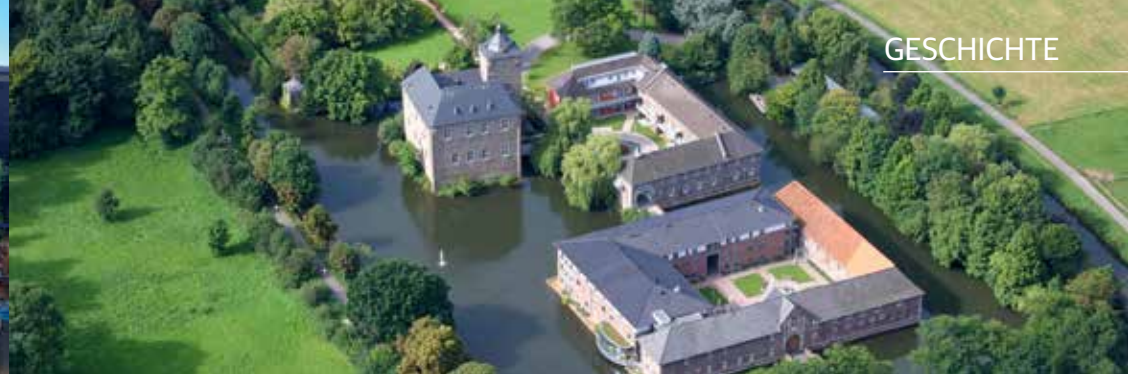
Die malerisch gelegene Burganlage Trips lädt zu entspannten Spaziergängen ein.