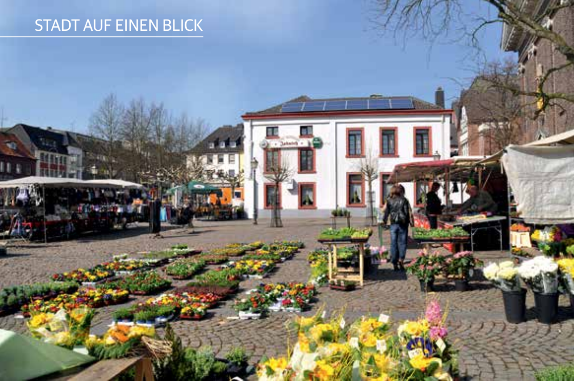
Wochenmarkt auf dem Marktplatz Geilenkirchen