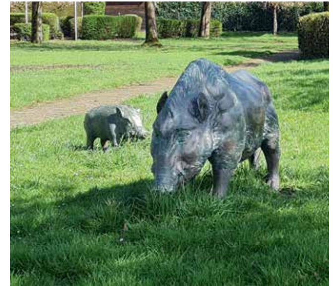
Der erste Namensteil des Ortes geht auf die einst hier lebenden Wildsäue zurück „Sügge“ oder „Sägge“

Süggerath entstand als Rodesiedlung im Prümmerer Hofverband als ein Straßendorf. Die Herren von Horrich waren bis zum 18. Jahrhundert auch die Herren von Süggerath. Bis zum Beginn der Industrialisierung war neben der Landwirtschaft die Holzverarbeitung Haupteinkommensquelle der Süggerather Bevölkerung. Nach Beginn der Industrialisierung lag Süggerath an der Eisenbahnverbindung Aachen-Düsseldorf. Dadurch entstanden auch hier neue Arbeitsplätze. Mit