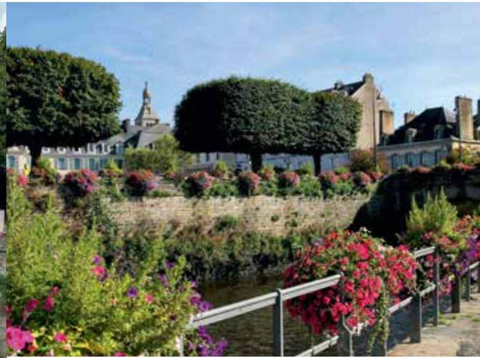
Ortskern unserer Partnerstadt Quimperlé