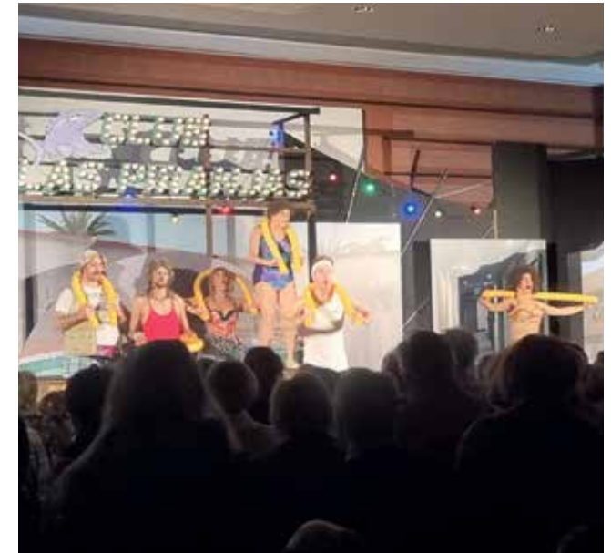
Tolle Aufführungen für jedes Alter

Das Grenzlandtheater Aachen gastiert mehrmals im Jahr mit Aufführungen aus der aktuellen Spielzeit in Geilenkirchen. Eintrittskarten für die Vorstellungen sind erhältlich im Bürgerbüro der Stadt Geilenkirchen, allen bekannten Vorverkaufsstellen oder unter www.adticket.de .