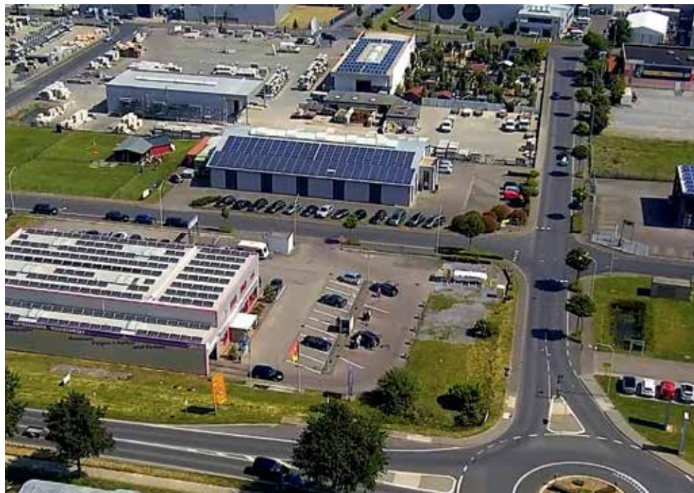
Gewerbegebiet Niederheid von oben