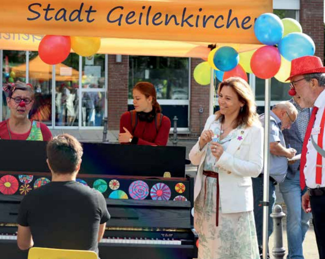
Öffentliche „Spiel-mich-Klaviere“ bringen Musik in die Stadt