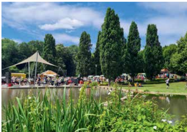
Der Wurmauenpark im Herzen von Geilenkirchen

sich. Neben den Kreis- und Gemeindeverbindungsstraßen wird zudem das Radwegenetz fortlaufend verdichtet.