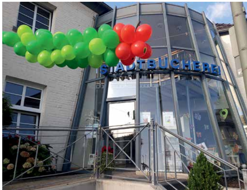
In der städtischen Bücherei finden Sie Bücher, Online-Angebote, Spiele und vieles mehr.

stehen Leserinnen und Lesern über 30.000 Medien zur Verfügung. Neben Büchern können auch Zeitschriften, Hörbücher, Tonies, DVDs und Spiele ausgeliehen werden. Außerdem können die Angebote auch online über den Onleihe-Verbund „Come In“ der Region Aachen, „Filmfreund“, Freegal Music“ und „Tigerbooks“ abgerufen werden. Zum Austesten stehen darüber hinaus E-Reader und Tonie-Boxen zur Verfügung. Neben dem umfangreichen Medienangebot betreibt die Stadtbücherei aktive Leseförderung für Kinder und arbeitet mit