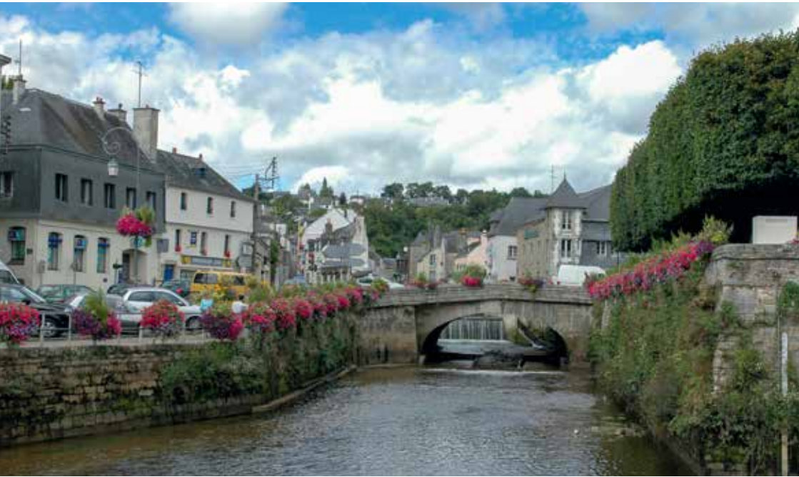
Durch Quimperlé fließt der Fluss „Laita“.