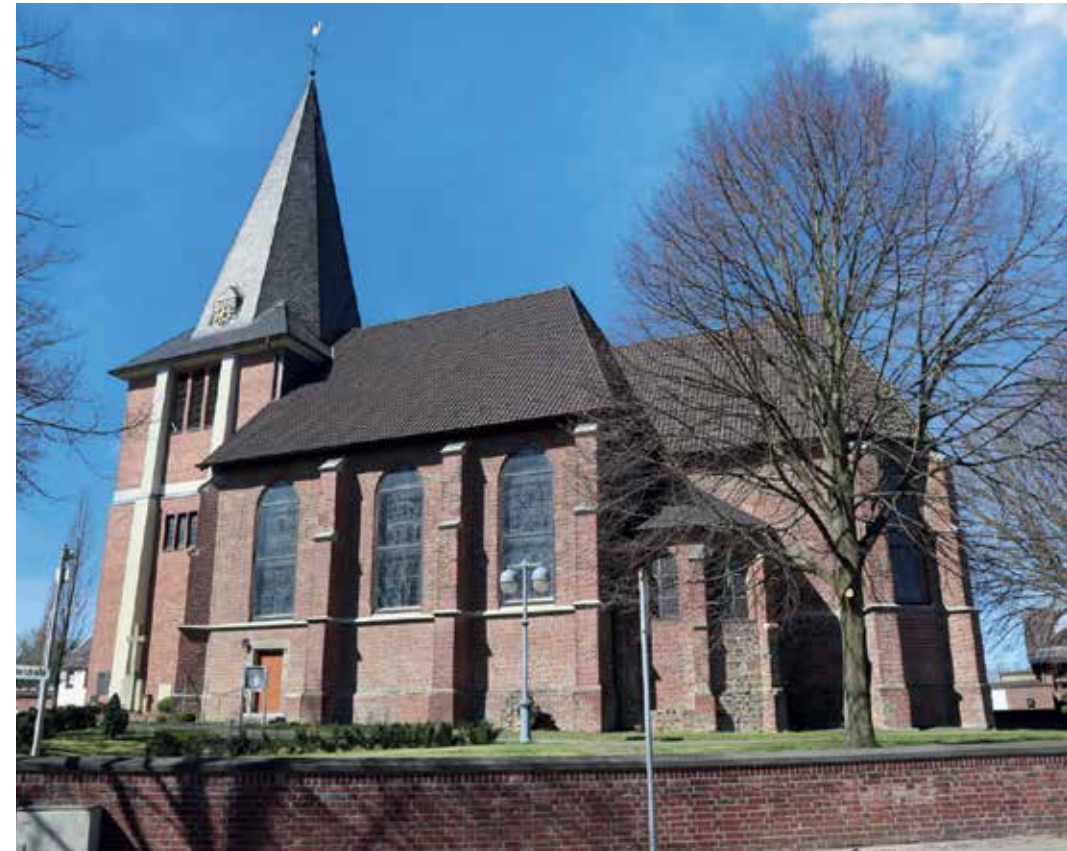
Pfarrkirche St. Gereon Würm

Bocket Das Dorf ist wie Panneschopp eines der kleinsten Dörfer im Stadtgebiet. Gemeinsam waren die Dörfer Produktionsstätte für Tondachziegel. Dass Bocket heute mit Teveren einen Stadtbezirk bildet, liegt an