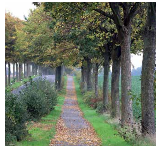
Jülicher Straße/Dürener Straße in Richtung Loherhof und Immendorf

Noch im 15. bis 17. Jahrhundert muss bei der Burg Trips ein Dörfchen namens Trips gelegen haben, dessen Bewohner um 1700 abgewandert sind. Auf der Suche nach einer besseren Siedlungsstätte gründeten diese das heutige Tripsrath. Dort sind in den letzten Jahren einige Neubaugebiete entstanden. Bemerkenswert sind das alte Haus Boomers von 1653 und der alte Tripsrath Hof, der ca. 200 Jahre alt ist. 1952 gründete Wilhelm Wolff ein Betonsteinwerk. Inzwischen wurde der Firmensitz aufgrund