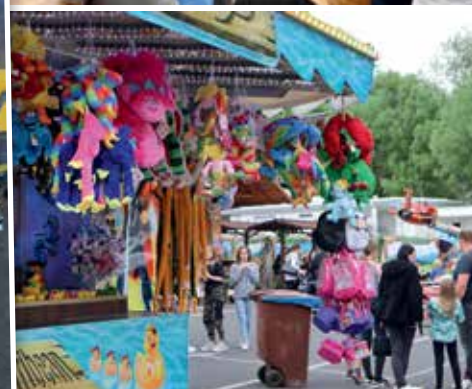
Viele Gelegenheiten für Freude und Geselligkeit