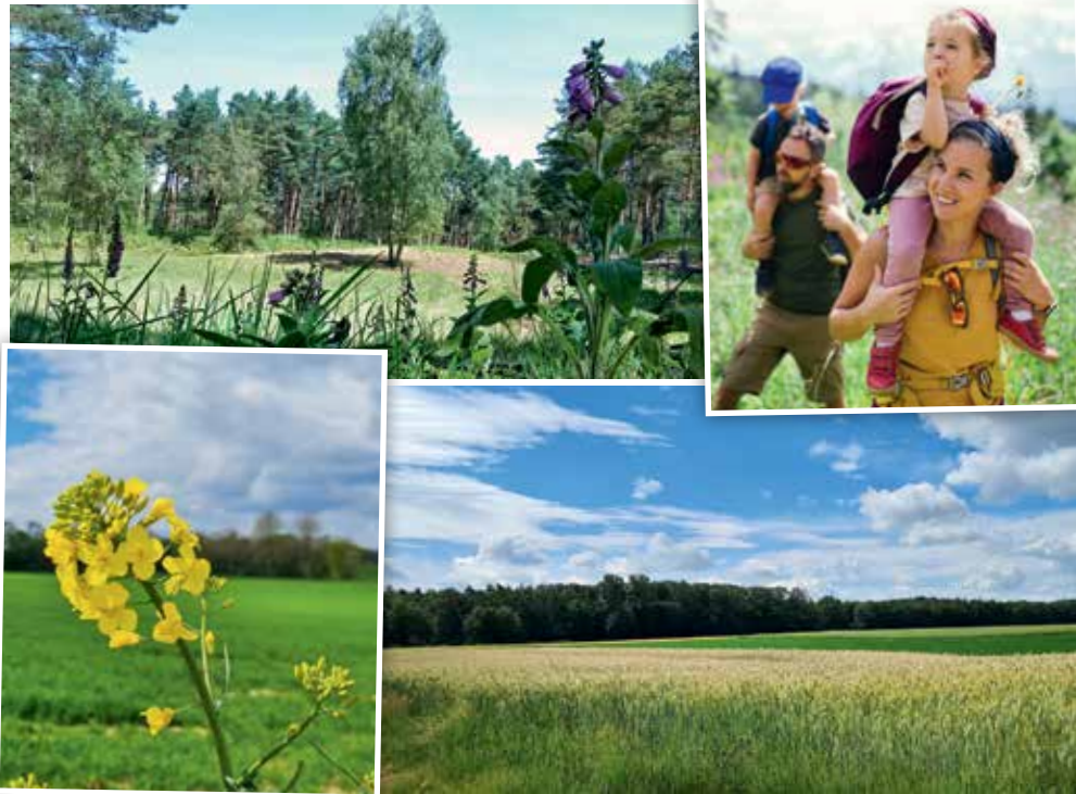
Im Naturschutzgebiet „Tevereiner Heide“ und in der ländlichen Umgebung Geilenkirchens kann man herrlich entspannen.

ten zahlreiche Möglichkeiten der Freizeitgestaltung. Im gesamten Stadtgebiet gibt es mehr als 150 Vereine, darunter Schützenbruderschaften, Karnevalsgesellschaften und Sportvereine, die ihre Traditionen und ihr Brauchtum pflegen und an die Jugend weitergeben. Durch die zahlreichen Veranstaltungen und Festlichkeiten ist daher immer etwas los.