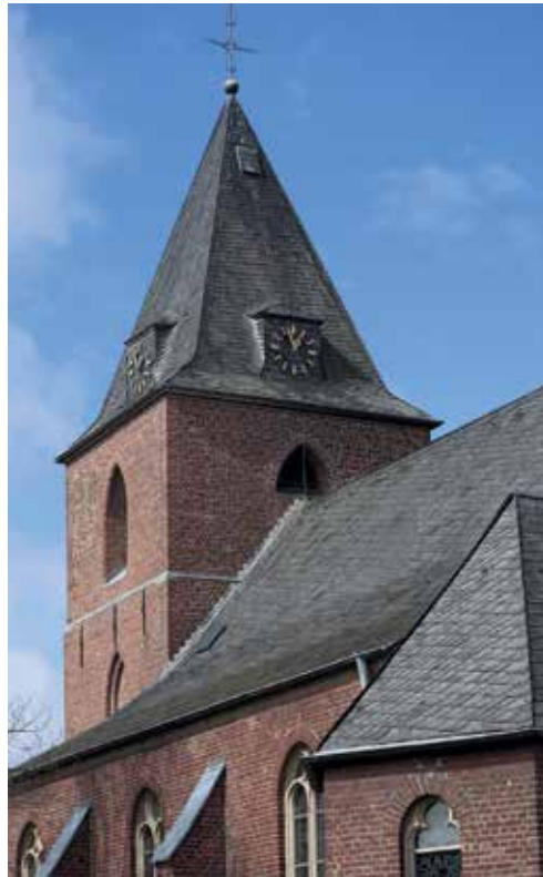
Bahnhof Lindern und Kirche in Prümmern

von Expansionen ins Gewerbegebiet Niederheid verlegt.