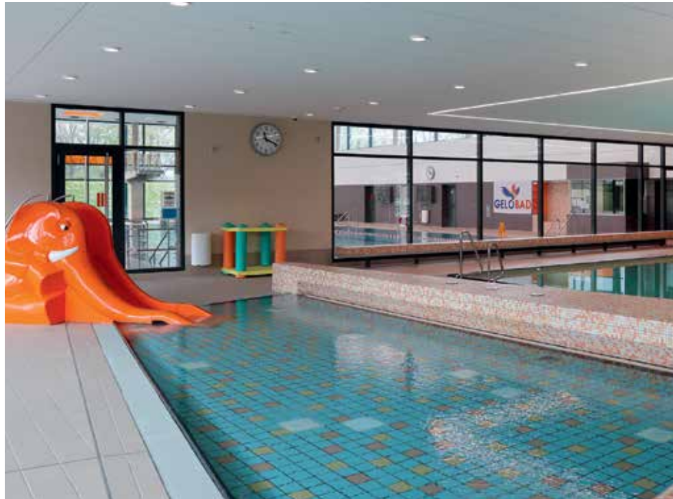
Im Gelobad haben auch die Kleinsten Spaß.

sind einige der Kurse, die hier angeboten werden. Das Gelobad ist ein Ort der Begegnung und des Spaßes und bietet auch Attraktionen für Familien. Kinder können sich in einem extra Kinderbereich des Pools austoben.