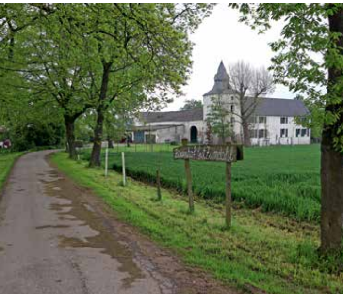
Ehemaliges Rittergut „Gut Zumdahl“

Erhalten und saniert wurde in den 1990er Jahren die Vorburg mit Torhaus und dem 1616 entstandenen Wohnhaus.