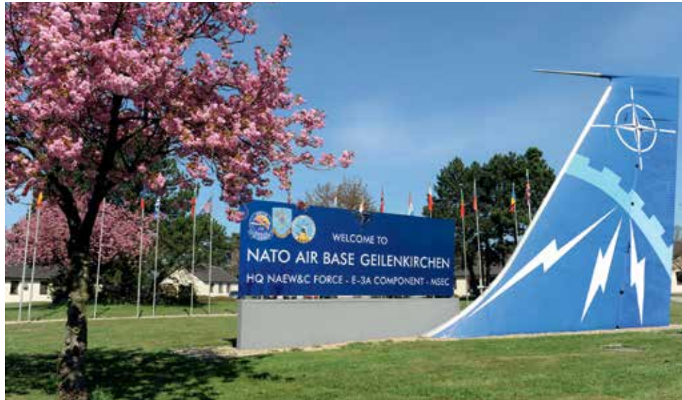
Eingang zur NATO-Airbase in Teveren