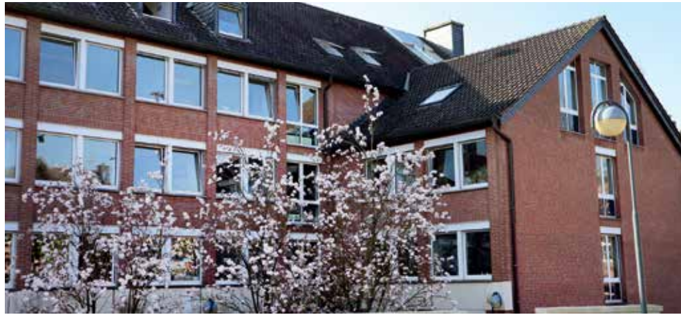
Das Rathaus liegt zentral am Geilenkirchener Marktplatz