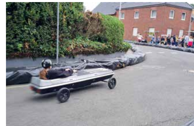
Seifenkistenrennen in Apweiler

Erstmalig erwähnt 1144 als Crutdorff, also ein Dorf inmitten von Krautfeldern. Die tatsächliche Bedeutung ist aber nicht klar. Kraudorf war ein kleines Kirchdorf abseits vom Hauptverkehrsweg, oberhalb des Wurmtals und damit sicher vor Hochwasser. Bei Kraudorf liegt „Gut Zumdahl“, ein ehemaliges