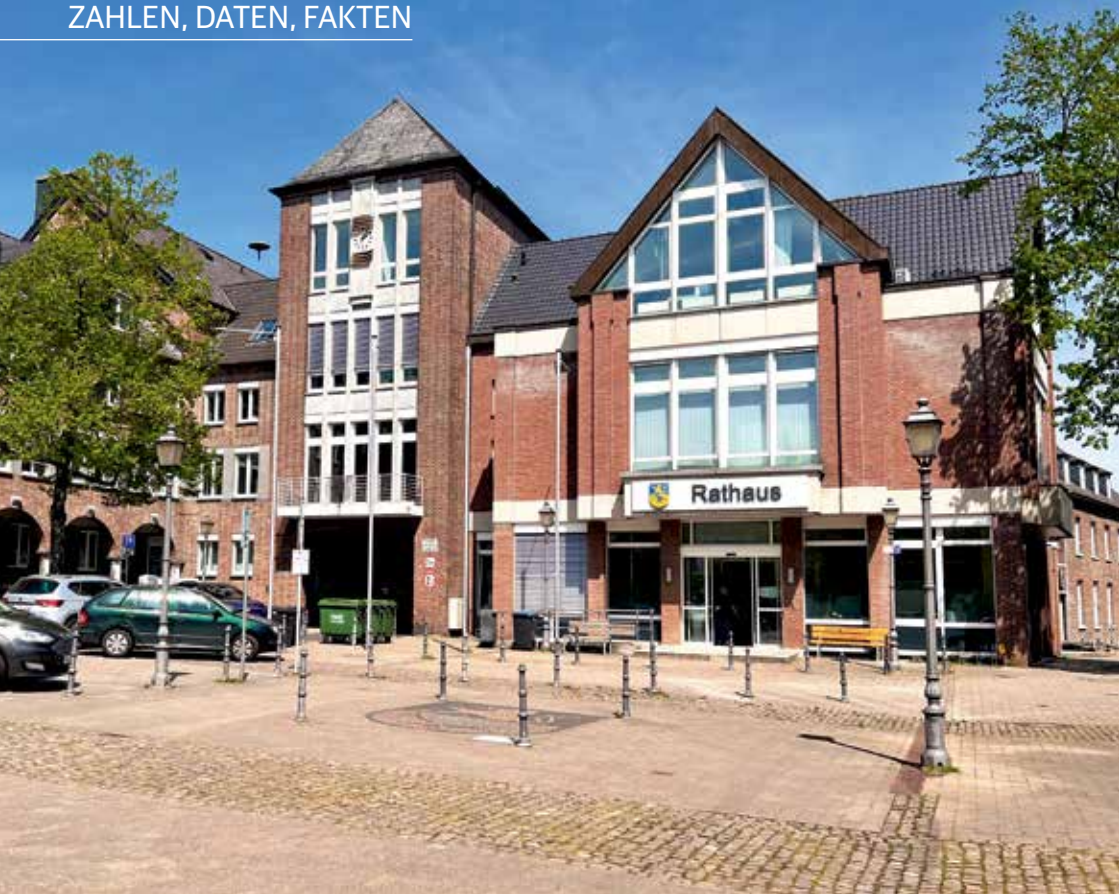
Rathaus der Stadt Geilenkirchen