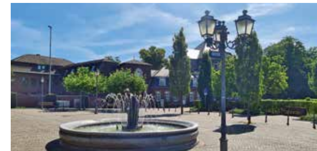
Brunnen am Marktplatz von Geilenkirchen vor dem Bischöflichen Gymnasium St. Ursula.

Erstmalig erwähnt wurde die Kirche von Hünshoven 1217. Heute befindet sich an ihrer Stelle ein Bau der bekannten Kirchenbaumeister Dominikus und Gottfried Böhm. Sie wurde 1951 geweiht und hat die Form einer Burg. In 1380 wurde die Ölmühle an der Wurm in Hünsho-