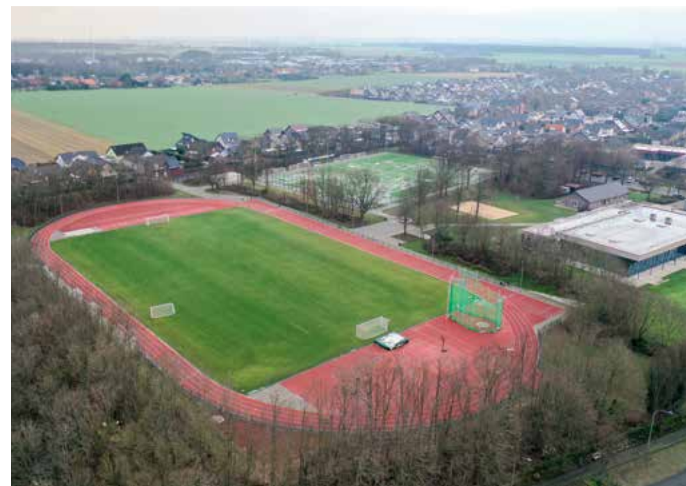
Moderne Sportstätten bieten vielfältige Möglichkeiten.