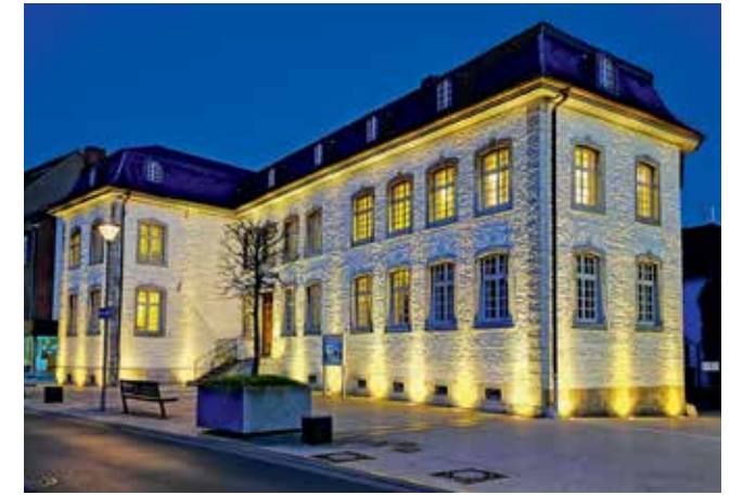
Das Haus Basten ist ein beliebter Veranstaltungsort.

Das vielfältige Kultur- und Veranstaltungsprogramm der Stadt Geilenkirchen begeistert sowohl Einwohnende als auch Besuchende von Nah und Fern. Konzerte, Ausstellungen und Veranstaltungsreihen, die sich teilweise über mehrere Tage erstrecken, gehören in Geilenkirchen jährlich dazu. Zu