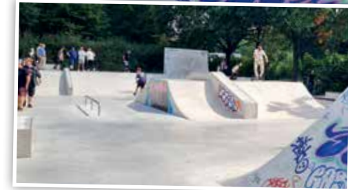
Die Skateanlage im Wurmauenpark ist ein beliebter Freizeittreff für junge Menschen.