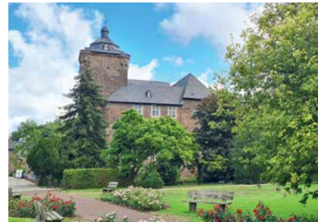
Burg Trips mit Parkanlage

Darüber hinaus besteht seit 1966 eine Partnerschaft mit der französischen Stadt Quimperlé in der Bretagne, die in der Bevölkerung beider Städte bereits tief verwurzelt ist. Wegen ihrer Bemühungen um das Zusammenwachsen der Europäer wurden den Städten Quimperlé und Geilenkirchen bereits hohe Auszeichnungen verliehen, so z. B. 1993 die Europafahne und 1998 die Europaplakette.