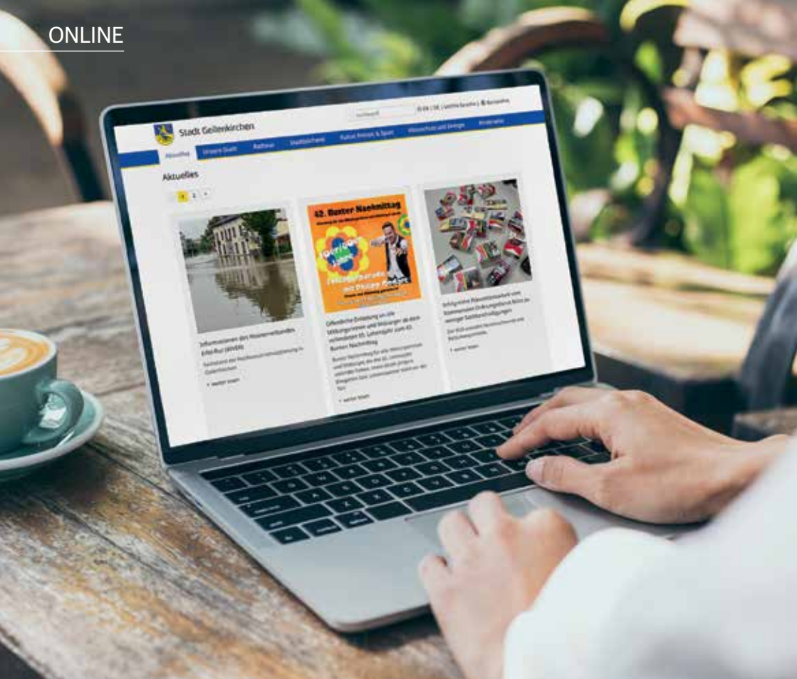
Bestens vernetzt in Geilenkirchen