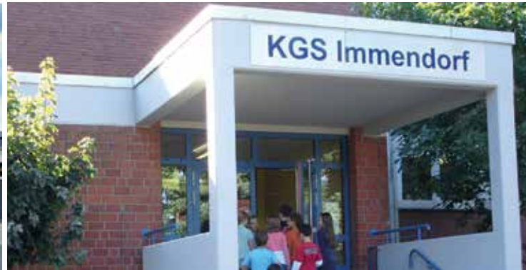
Die Grundschulen in Geilenkirchen bieten einen optimalen Einstieg in die Schullaufbahn